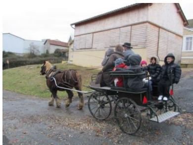
Zoom sur « Main d'or »

L'association propose des après midi récréatifs consacrés à des jeux de société.