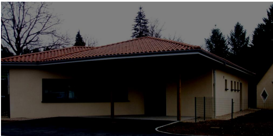
ALSH Les Bricouloous et Périscolaire l'Arc En Ciel sur la commune de Saint Amand de Vergt